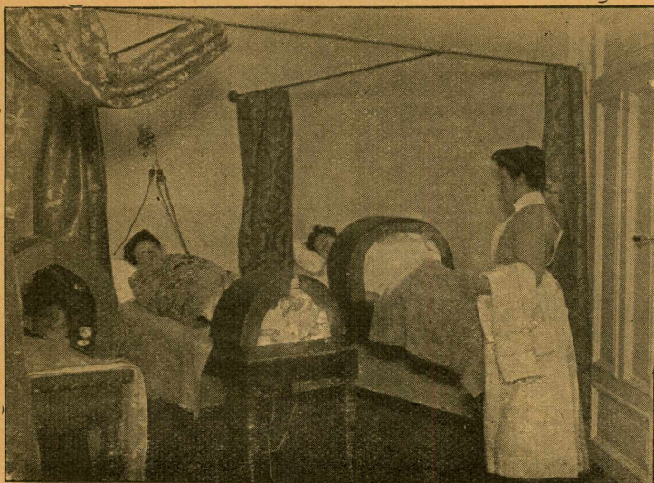
Kurbadet: Lysbehandlingen paa den kvindelige Afdeling.

høre de forskjellige Bemærkninger, der kommer fra Gjøster og Patienter angaaende Kurbadet.