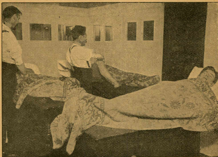
Kurbadet: Massage paa den mandlige Afdeling.

Siden min sidste Rapport har vi haft Daab i Hauge-